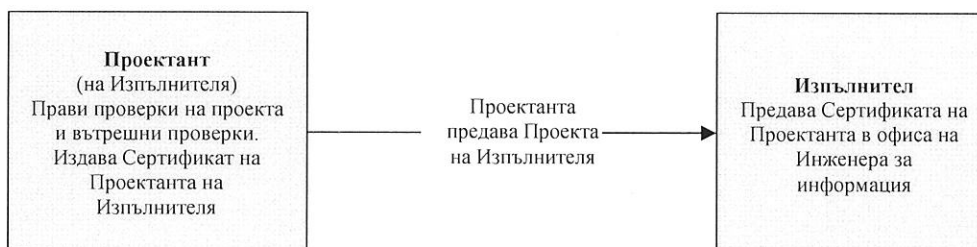
Фигура 3 - Диаграма на разглеждането и удостоверяването на Проекта. (само вътрешна проверка на Проектанта)

За проектна работа, която е била проверена и удостоверена само от Проектанта, проверката и удостоверяването ще следва процеса, показан на фигура 3 – Диаграма на Разглеждането и удостоверяването на Проекта.